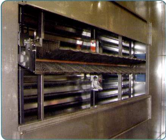
Brûleur dans veine d'air (Make-up)

pour locaux de traitement de surfaces (cabines de peinture)